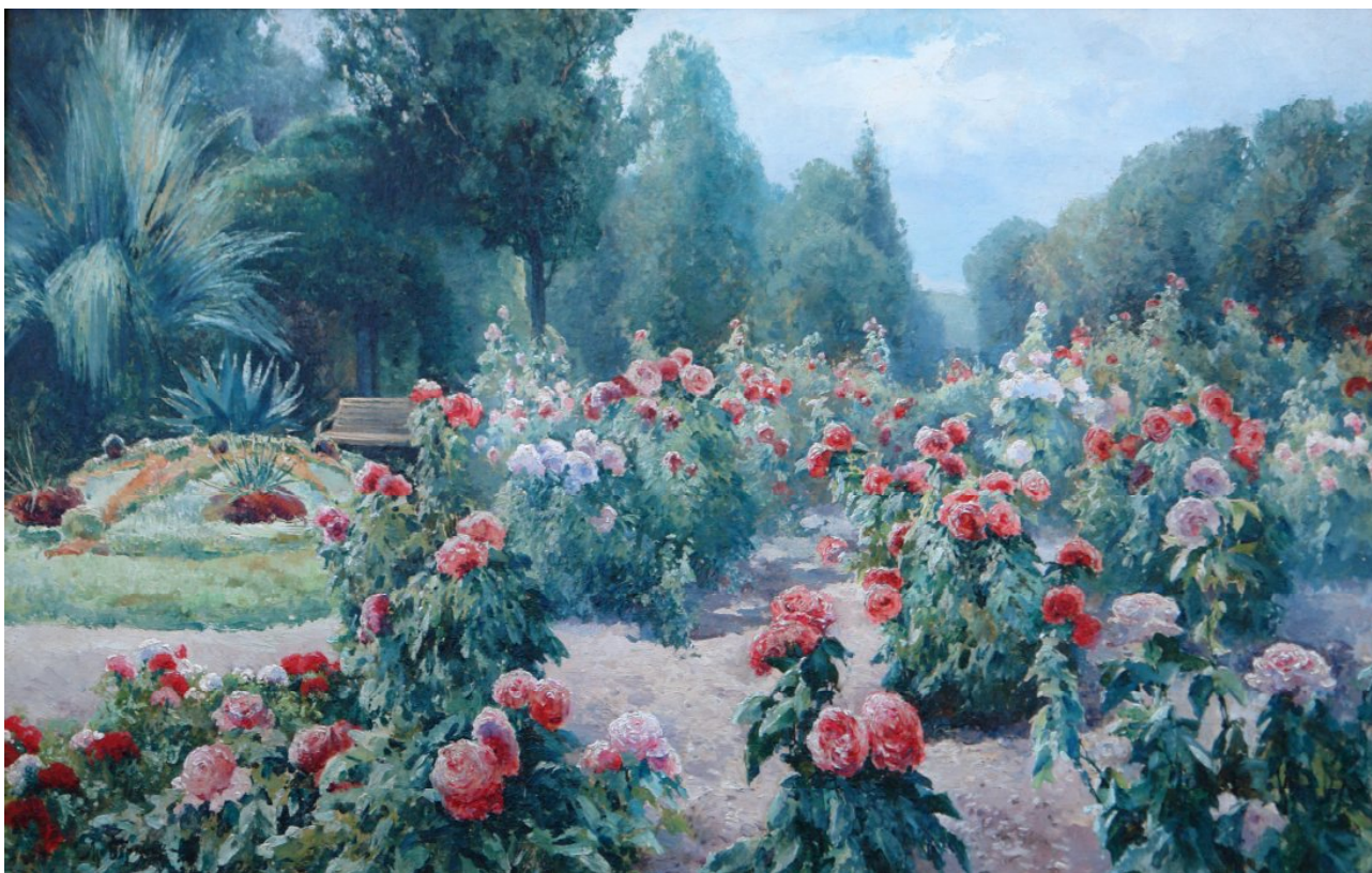
Рис. 2. М. Беркос. Троянди. З колекції С. Давидова