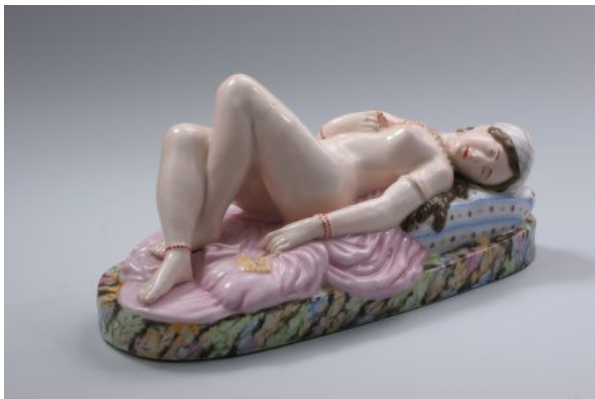
Рис. 1. Одаліска. Завод Міклашевського. З колекції К. Шпектор