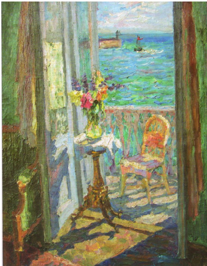
Рис. 5. Л. Крамаренко. Ранок біля моря. З колекції І. Лучковського