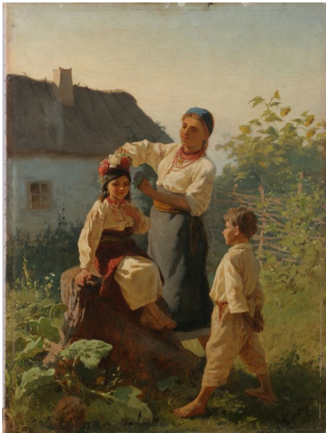
Рис. 3. К. Трутовський. Одягають вінок. З колекції С. Давидова