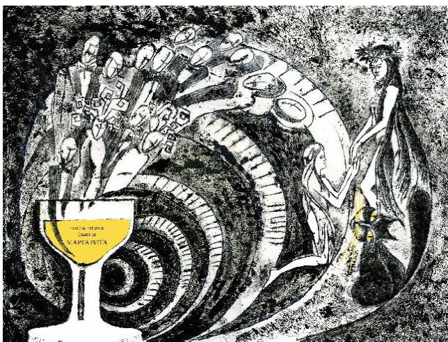
Рис. 3. С. Куколь. Монотипія. Шмуцтитул до другої частини роману М. Булгакова «Майстер і Маргарита»