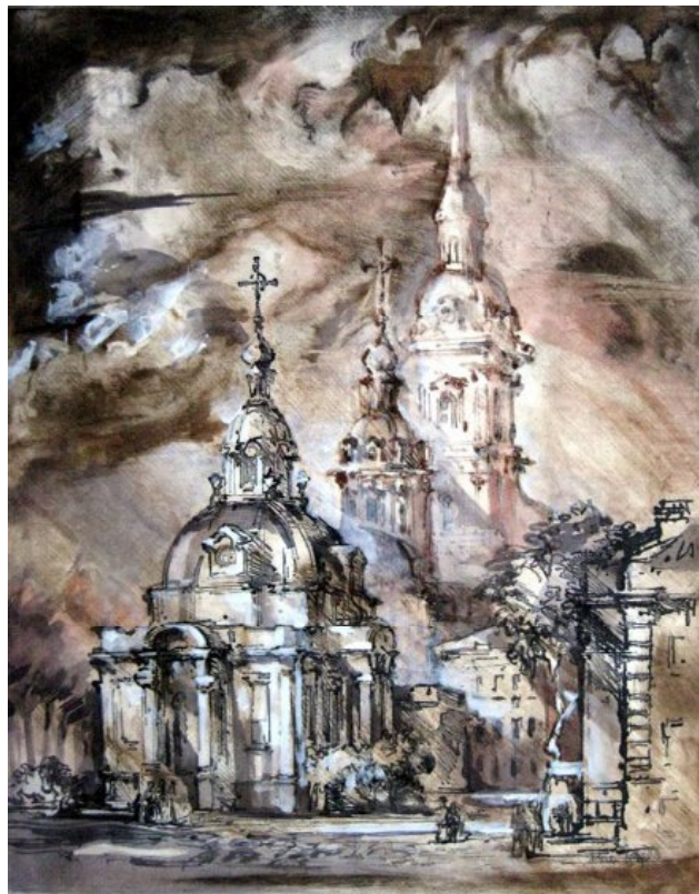
Рис. 2. О. Чорна. Монотипія. Серія «Архітектура» [11]