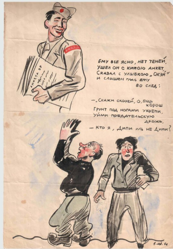
Лл. 2. В. Елліс, В. Одіноков. Кампанія скріннінгу («просіювання») ДіПі. Аркуш осіннього випуску. 1946 (листопад). Мюнхен-Пазінг