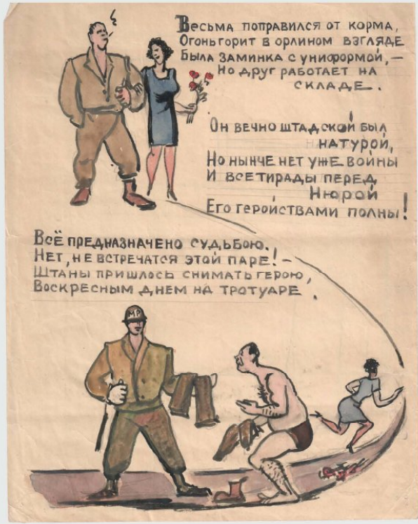
Іл. 5. В. Елліс, В. Одіоков. Кампанія проти спекуляції американськими військовими речами. Аркуш весняного випуску. 1946 (травень?). Мюнхен-Пазінг