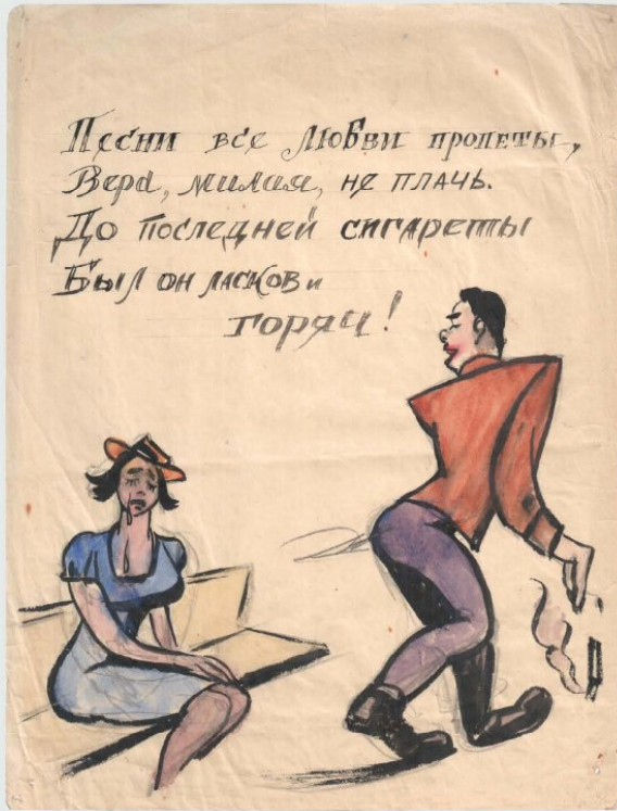
Іл. 4. В. Елліс, В. Одіоков. «Цигаркова комунікація». Аркуш весняного випуску. 1946 (травень?). Мюнхен-Пазінг