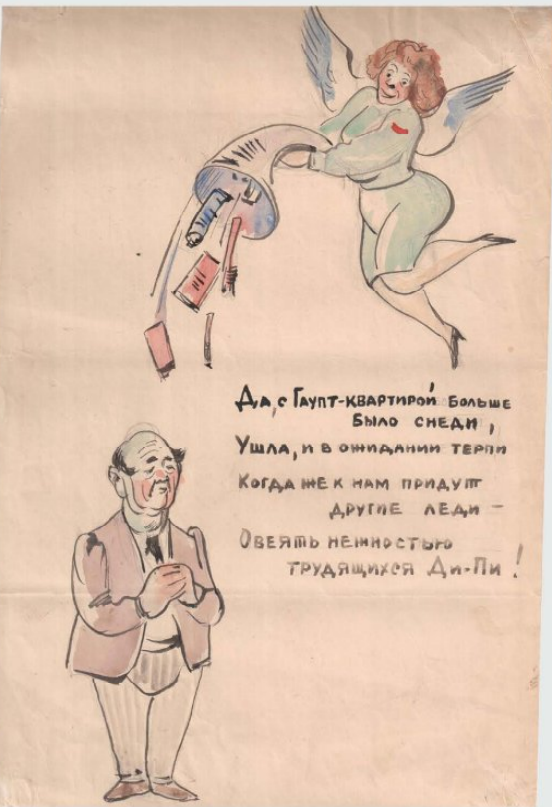
Іл. 6. В. Елліс, В. Одіоков. Сатиричні роздуми з приводу зміни підпорядкування табору. Аркуш зимового випуску. 1946 (грудень). Мюнхен-Пазінг