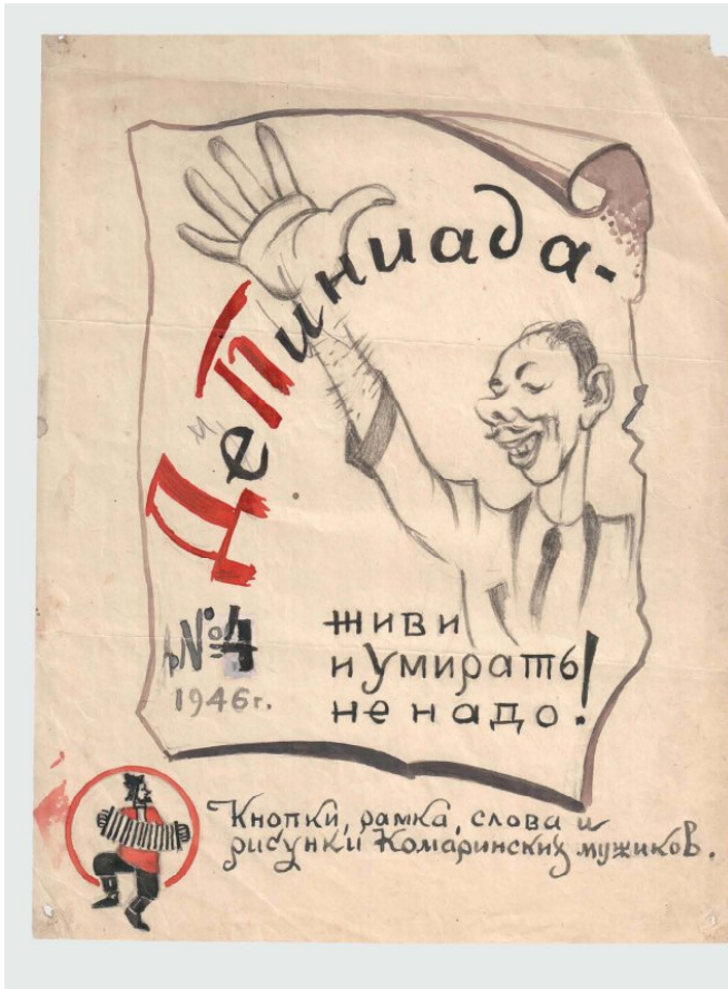
Лл. 1. В. Елліс, В. Одіноков. Обкладинка «ДіПінади». Графічне рішення обкладинки для випусків 1-4. Випуск 4. 1946 (квітень?). Мюнхен-Пазінг