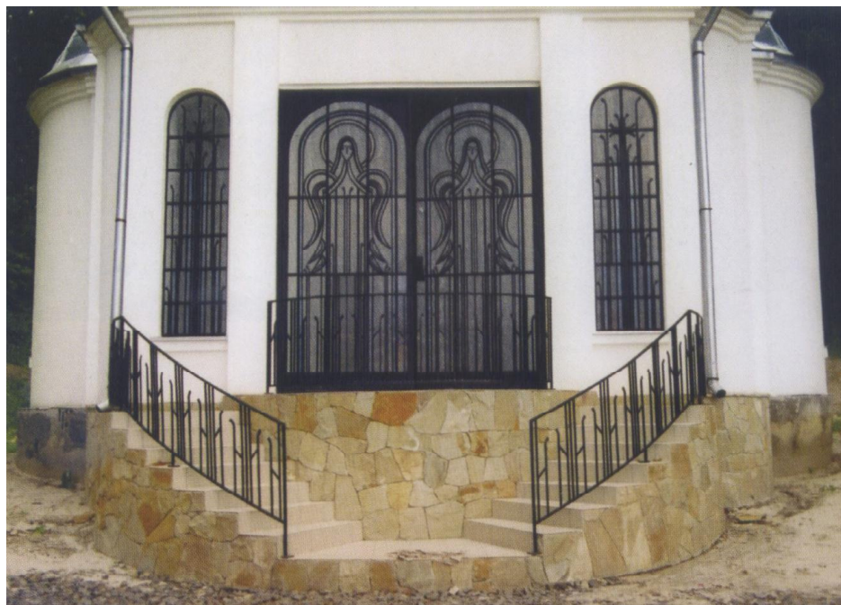
Іл. 1. О. Боньковський. Архітектурно-художнє оформлення каплиці Благовіщення монастиря отців Василіанів. Залізо, кування, вітраж, камінь. Львів. 2003