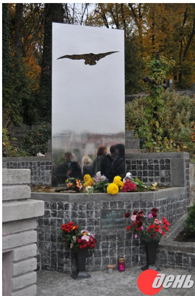
Іл. 4. О. Золотарьов. Пам'ятник рок-музиканту С. Кузьмінському. Нержавіюча сталь, полірування. Львів, ЛКП «Музей "Личаківський цвинтар"». 2014