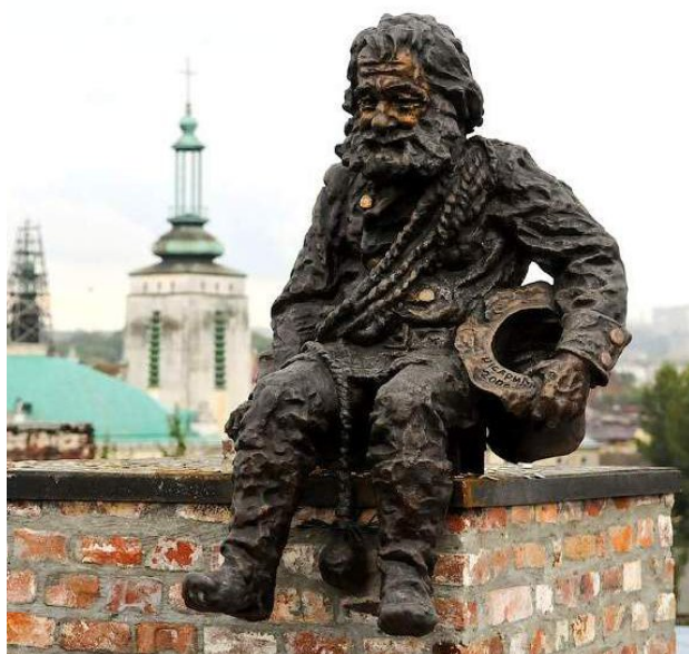
Іл. 3. В. Цісарик. «Сажотрус на даху». Бронза, литво. Дах ресторану «Дім легенд», Львів, вул. Староєврейська, 48. 2010