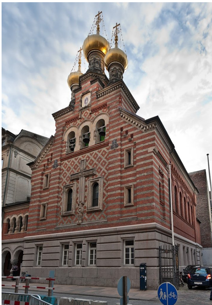
Ил. 1. Церковь св. Александра Невского в Копенгагене