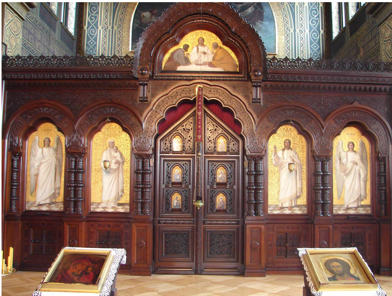
Ил. 3. Иконостас