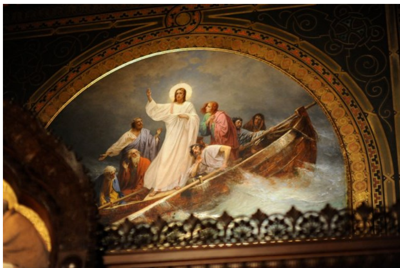
Ил. 4. Ф. А. Бронников. Иисус с учениками на Генисаретском озере