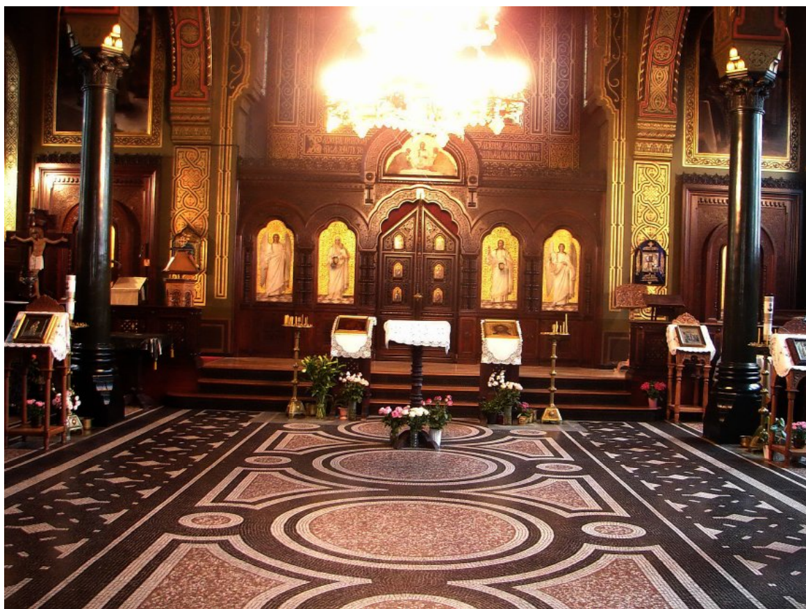
Ил. 2. Интерьер церкви