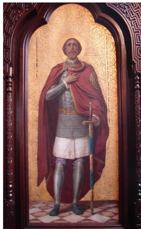
Ил. 5. Ф. А. Бронников. Св. князь Александр Невский (южный киот)