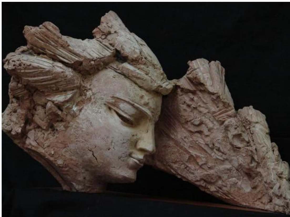
Рис. 1. Данилюк Т. Спогад. 22×80×42. Шамотна маса. 2008