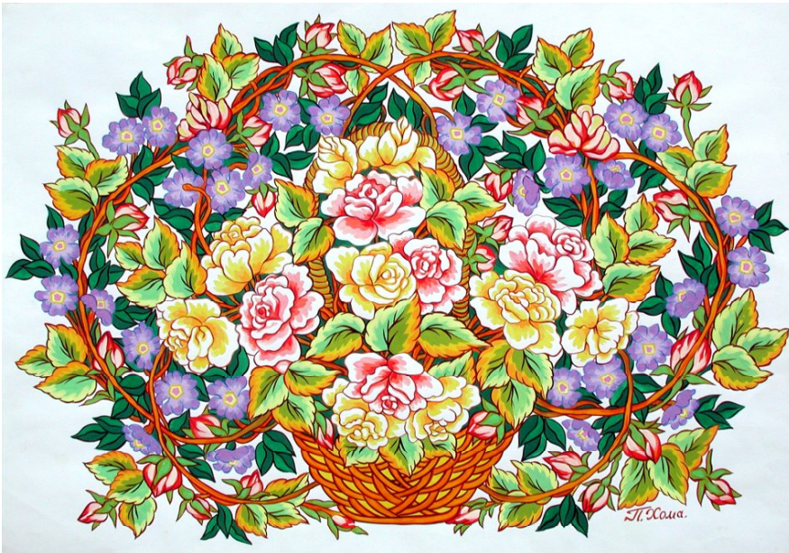
Троянди та барвінок, 83x60.1, 2003