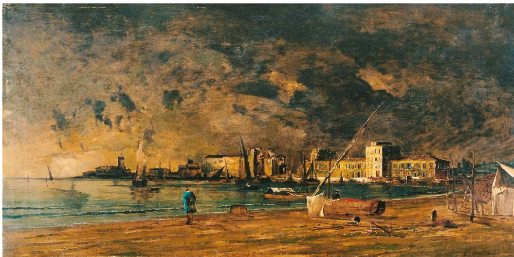
Рис. 1. Порто д'Анціо. Перед грозою. 1873