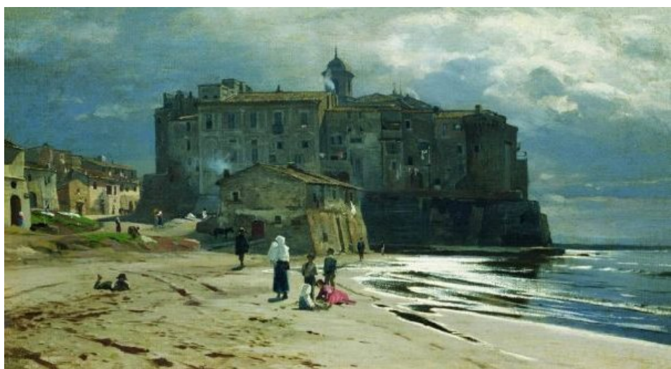
Рис. 6. Місто на березі моря. Середина 1870-х рр.