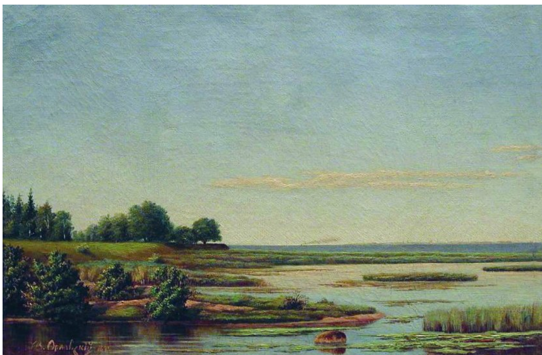
Рис. 2. Літній пейзаж. 1874