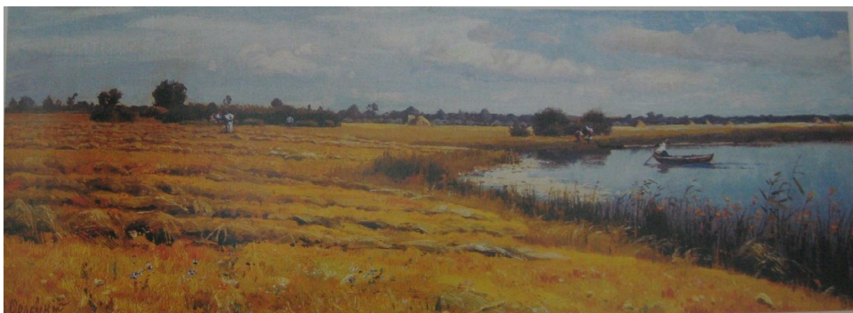
Рис. 8. Хліба зріють. Середина 1870-х рр.

та невеликі острівці, що ритмічно розташовані по діагоналі углиб композиції. Художник досить часто застосовує подібний композиційний прийом, оживляючи статичну врівноважену схему картини динамічним діагональним елементом, чи то річка, чи стежина або алея серед дерев.