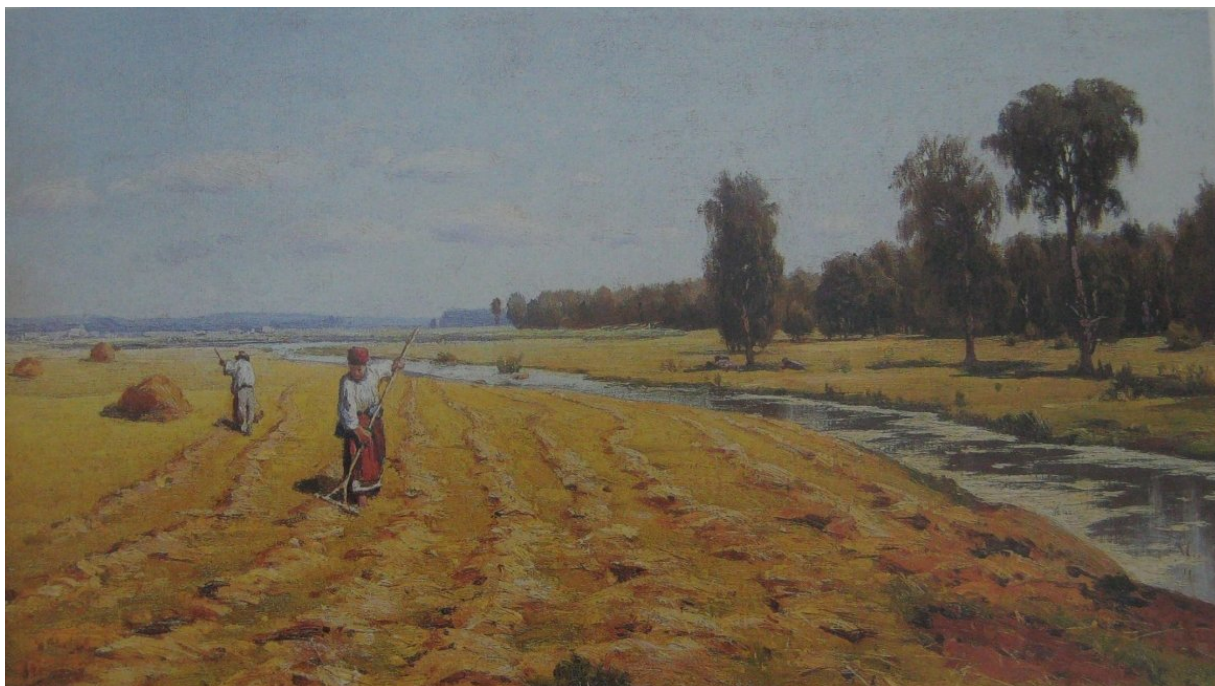
Рис. 7. На покосі. 1878