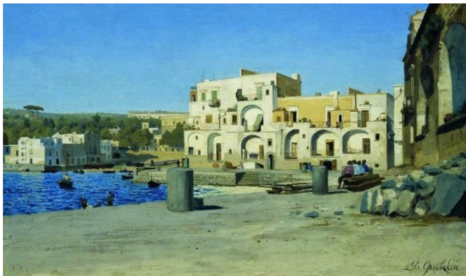
Рис. 4. В Італії. 1876