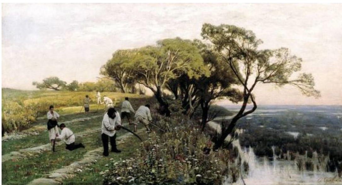
Рис. 10. Косарі. 1878

застосовує контраст кольорів, збагачує тональну палітру, застосовує більш глибокі відтінки.