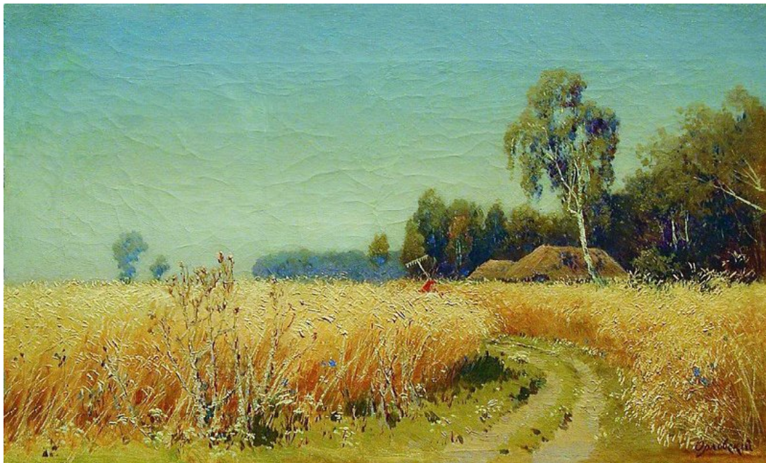
Рис. 9. Сінокіс біля озера. 1878