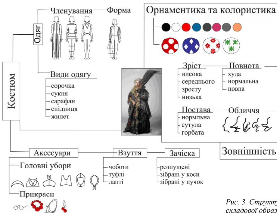
Рис. 3. Структурна схема візуальної складової образу Баби-Яги