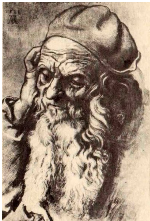
Рис. 2. А. Дюрер. Старий

вана система виховання художників була прийнята за зразок при відкритті перших державних академій мистецтв.