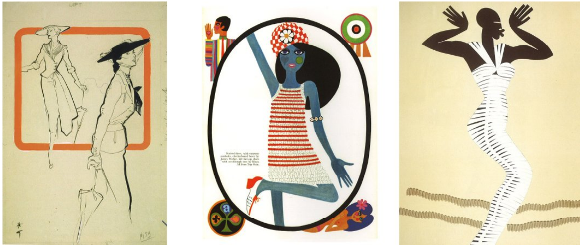
Рис.1. Інлюстрації моди а) Rene Gruau б) Caroline Smith в) Michael Roberts