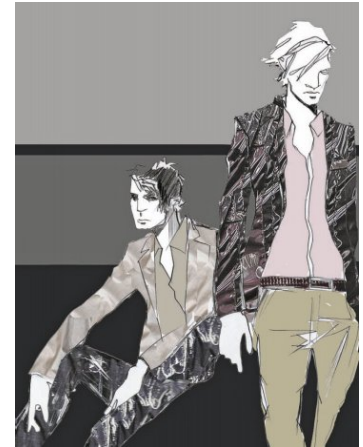
Рис. 4. Презентаційний ескіз