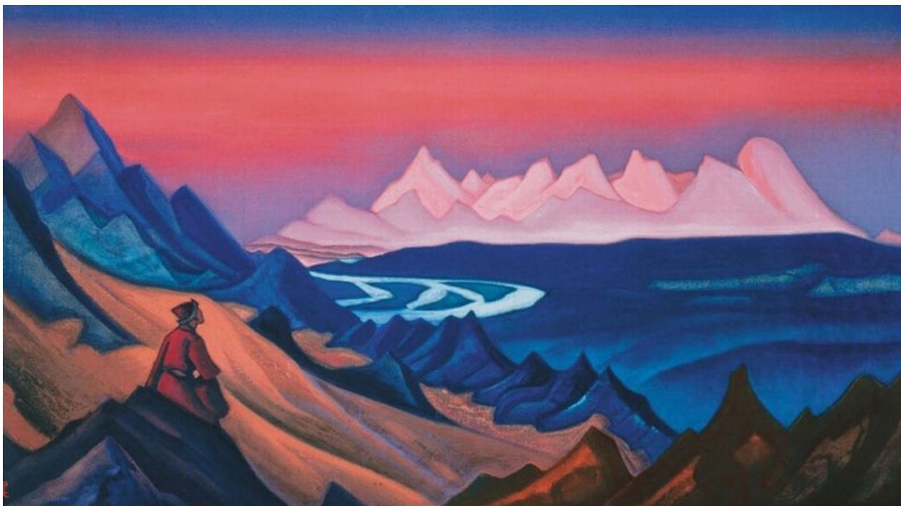
Лл. 1. М. Реріх «Песнь о шамале»