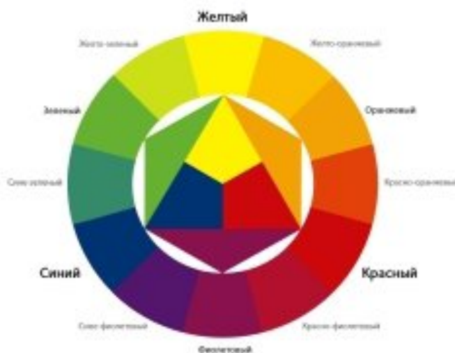
Лл. 3. Кольорове коло

Білий колір разом із чорним належить тріаді основних ахроматичних кольорів. Білий — це колір богів, святих, праведників. Єгипетські жерці носили білий одяг, у такій же колір одягали богів і небіжчиків. Для античних філософів білий був першим божественним кольором. У християнській традиції біле означає спорідненість з божественним світлом. Як писав В. Кандинський, «біле — символ миру, символ народження, де зникли усі фарби, усі матеріальні властивості й субстанції...» [2].