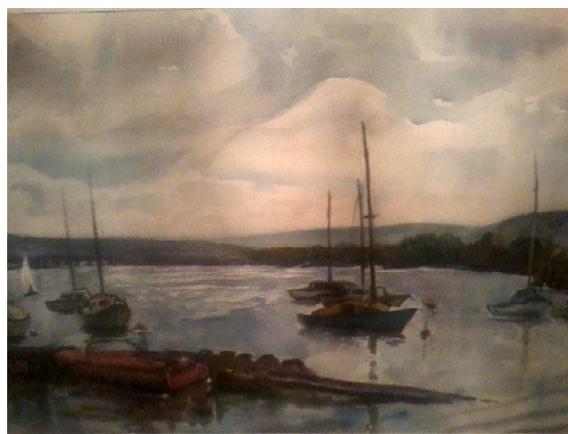
Гл. 1. Авторські твори, які демонструвалися на художніх виставках

Отже, істотним для формування творчих умінь є те, що педагог повинен уміло й грамотно, використовуючи методи, технології та педагогічні умови під час навчально-виховного процесу, створювати з кожного студента творчу особистість, допомагати йому формувати власні творчі уміння.