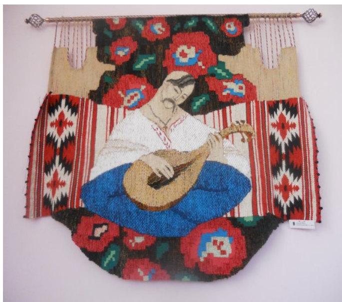
Іл.4. Гобелен «А вже років 200..» О. Ямборко; 2013 р.