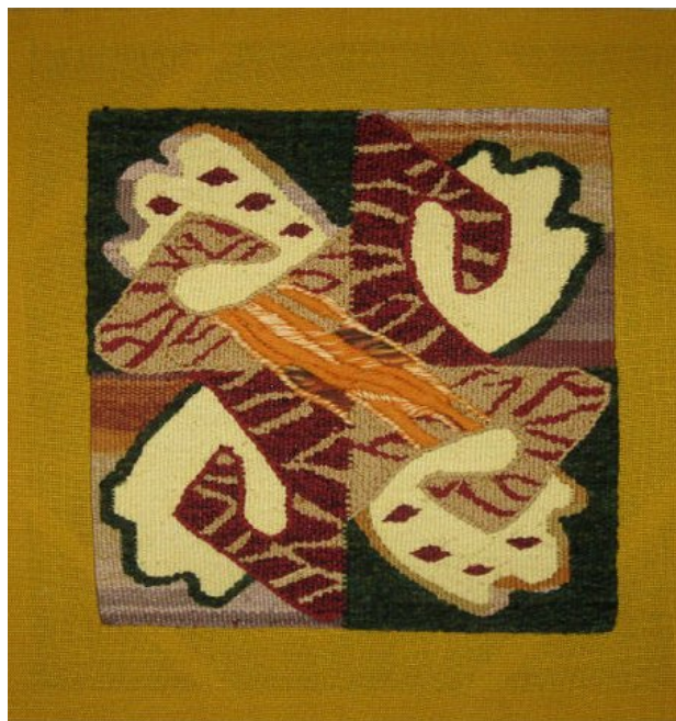
Іл.6. Гобелен «Коловорот» О. Ямборко; 2012 р.