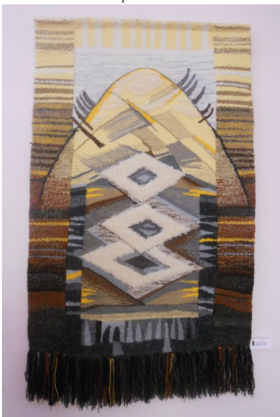
Іл.2. Гобелен «Магура» О. Ямборко; 2010 р.