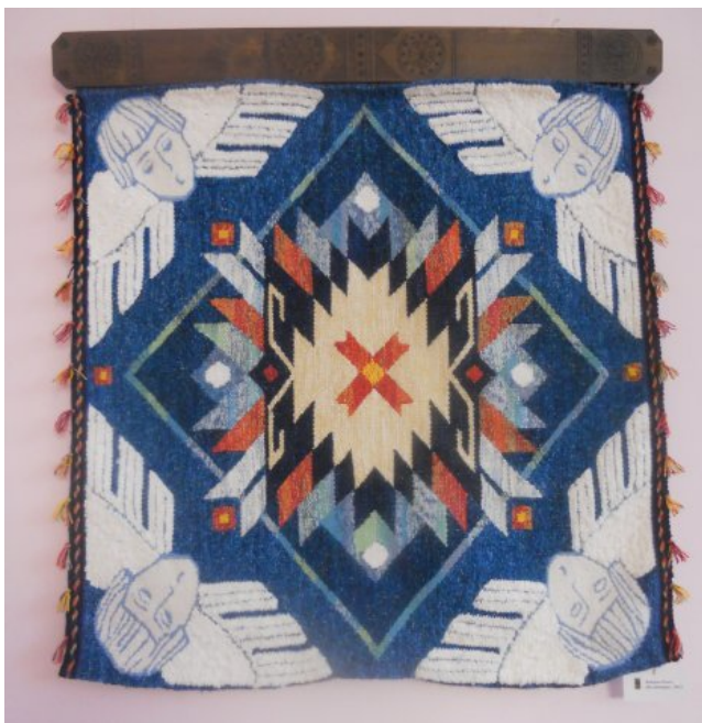
Іл.5. Гобелен «Колядниця» О. Ямборко; 2011 р.