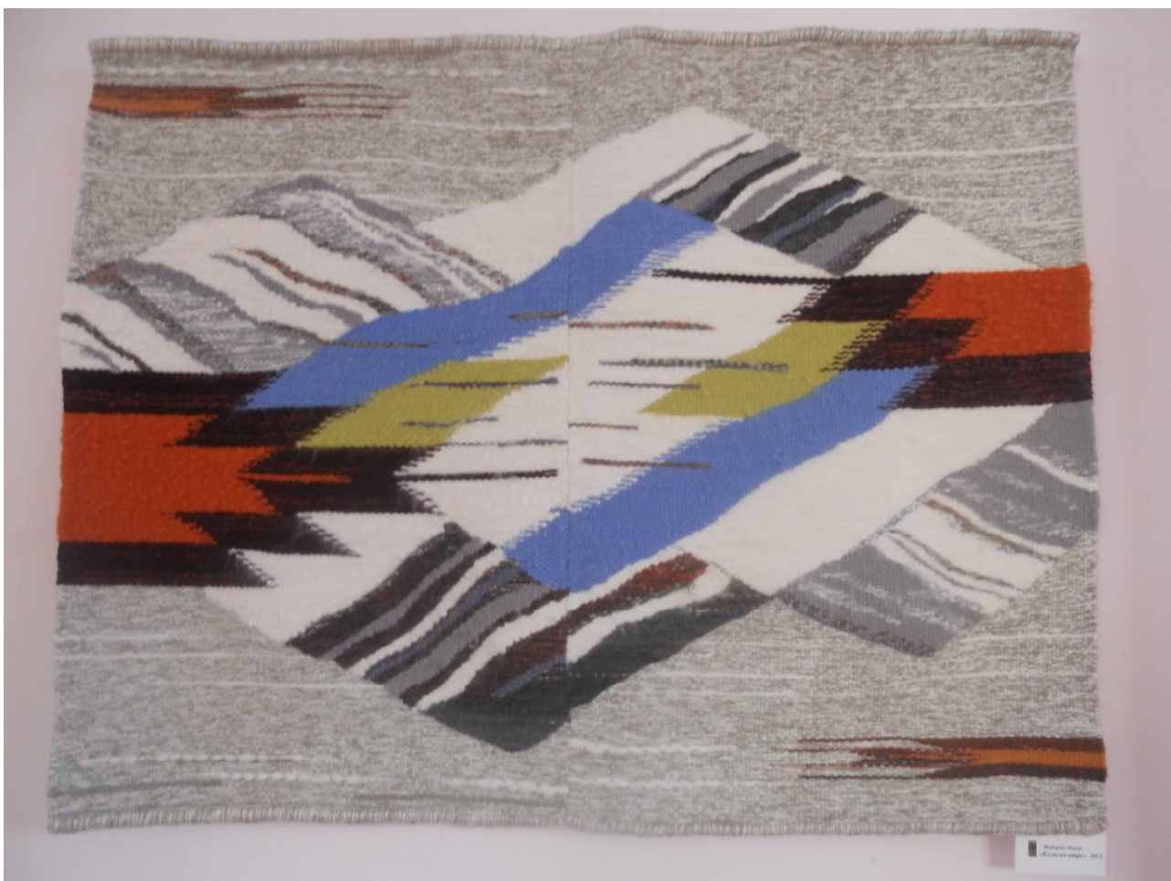
Іл.7. Гобелен «Колиска вітру» О. Ямборко; 2013 р.