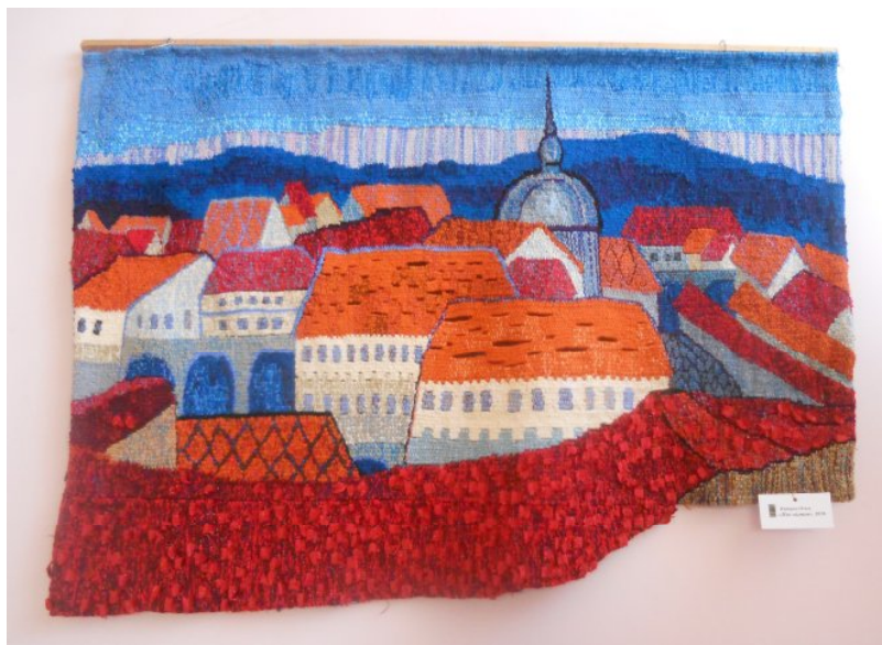
Іл.3. Гобелен «Над містом» О. Ямборко; 2010 р.