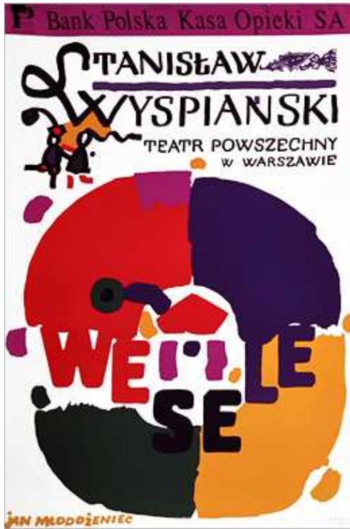
Рис. 1. Ян Млодоженець

Театральна афіша — найдавніший жанр польського плакату. Міцні театральні традиції та потреба у рекламі театральної вистави зумовили ак-