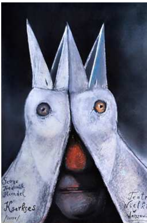
Рис. 3. Стасис Ейдрігевичус