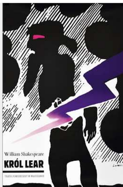
Рис. 8. Ян Леніца