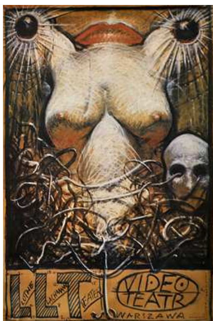
Рис. 7. Францішек Старовейський