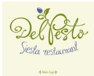
Рис. 5. Ярослав Шкрібляк. Логотип ресторану «Del Pesto». Івано-Франківськ, 2013