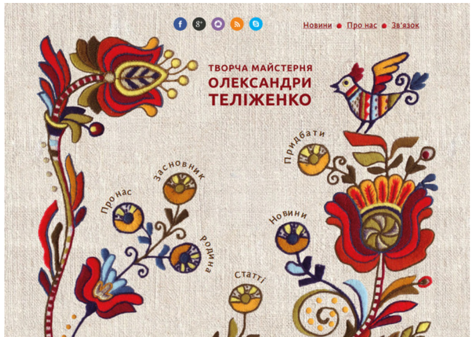
Рис. 2. Богдан Гдаль. Інтерфейс сайту Творчої майстерні Олександри Теліженко. Київ, 2013