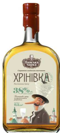
Рис. 7. Ярослав Шкрібляк. Дизайн пакування горілки «Хрінівка». Івано-Франківськ, 2012