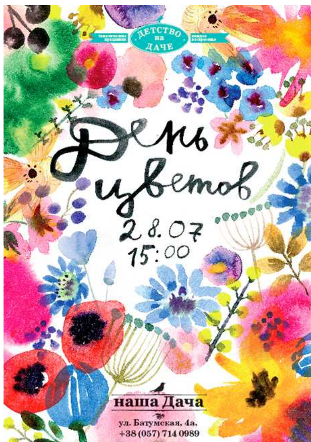
Рис. 11–12. Марія Рубан. Рекламні постери з серії «Наша дача». Харків, 2013