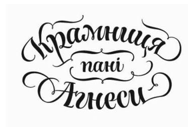
Рис. 13. Вікторія і Віталіна Лопухіни. Логотип «Крамниця пані Агнеси». Київ, 2012

Подальші наукові дослідження можуть бути спрямовані на вивчення інших тенденцій розвитку сучасного графічного дизайну в Україні й за кордоном.