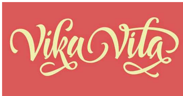
Рис. 14. Вікторія і Віталіна Лопухіни. Логотип «Vika i Vita». Київ, 2012