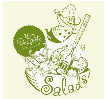
Рис. 6. Ярослав Шкрібляк. Елементи ідентифікаційного стилю ресторану «Del Pesto». Івано-Франківськ, 2013