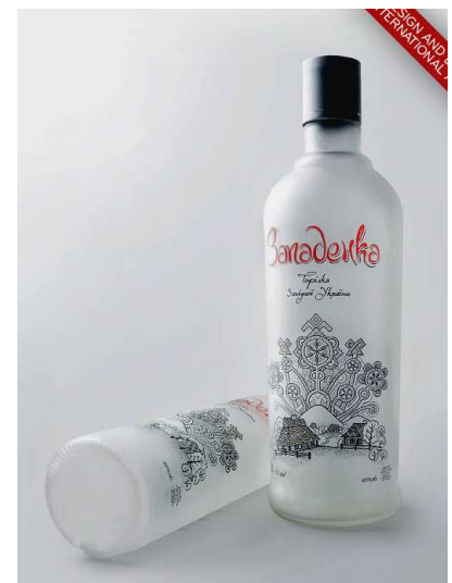
Рис. 8. Ярослав Шкрібляк. Дизайн пакування горілки «Западенка». Івано-Франківськ, 2013