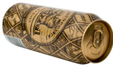
Рис. 3–4. Юрко Гуцуляк. Дизайн пакування й реклами лімітованої серії пива «Велкопопицький козел». Київ, 2011