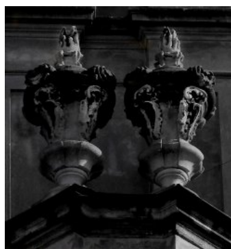
Рис. 4 Декор фасаду Домініканського собору (м. Львів)