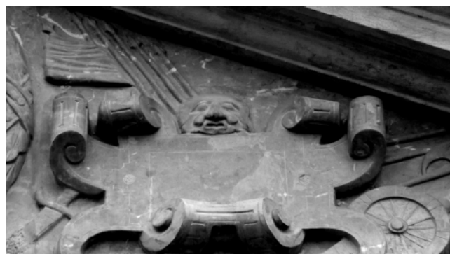
Рис. 5 Фрагмент порталу Жовківського замку

нувати як роль самостійного елемента оздоблення, так і бути доповнюючою складовою композицій.