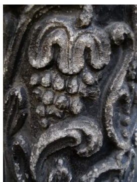
Рис. 3 Деталь порталу каплиці Трьох святителів (м. Львів)