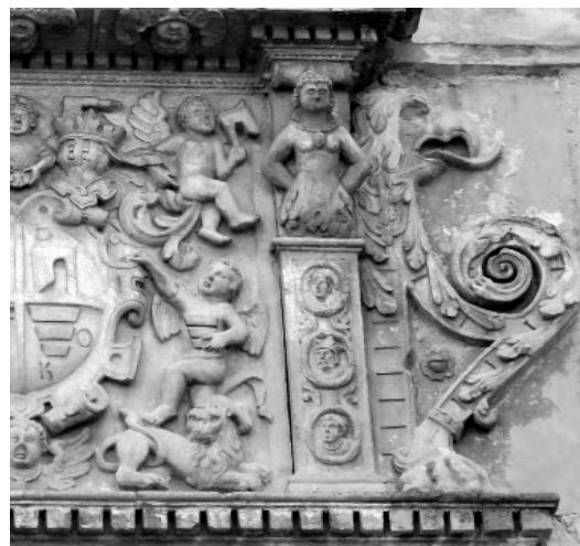
Рис. 2 Фрагмент порталу Олеского замку