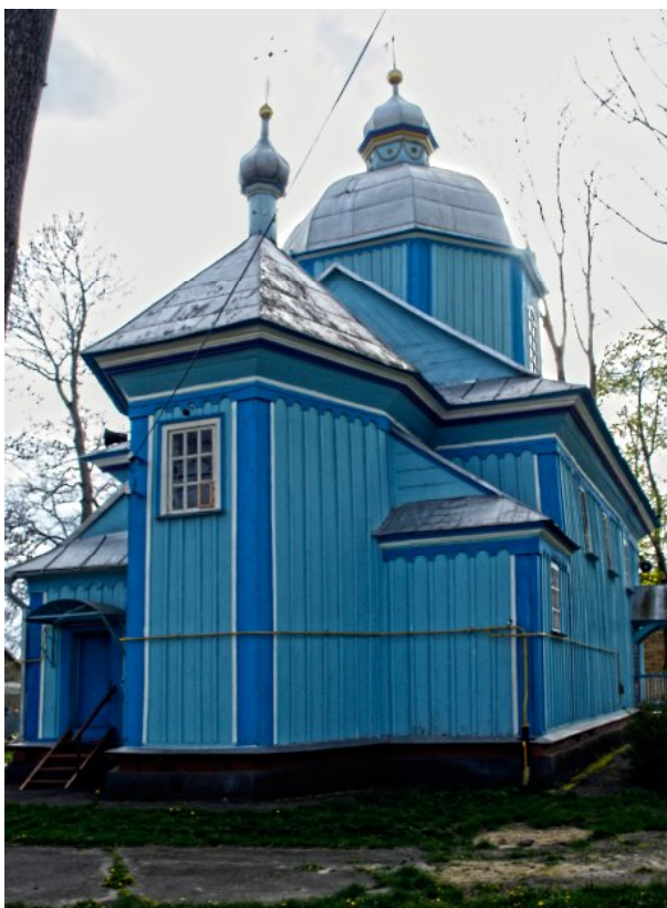
Рис. 2. Церква Іоанна Предтечі в с. Забороль Рівненського району, 1762 р.; а — фрагмент північного фасаду. Фото П. Ричкова, 2007 р.; б — фрагмент північного фасаду. Фото П. Ричкова, 2014 р.