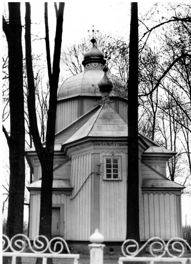
Рис. 1. Церква Іоанна Предтечі в с. Забороль Рівненського району, 1762 р. Загальний вигляд зі сходу. Фото П. Ричкова, 1987 р.

Однак, найбільшої шкоди храмовому архітектурному образу завдає ліквідація дрібних архітек-