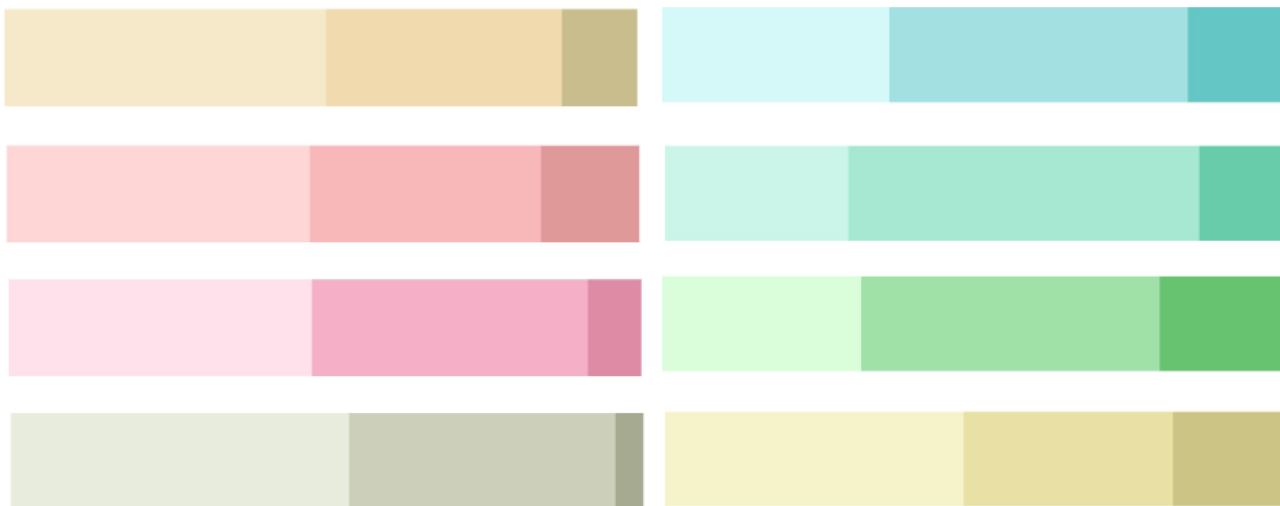
Рис. 2. Кольорова гамма, притаманна стилю «романтизм»