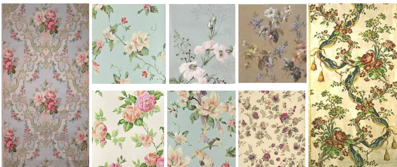
Рис. 3. Зразки флористичних елементів орнаменту

Орнамент текстильних виробів стилю «романтизм» має певні особливості композиційного розташування елементів на площині рисунку. Для романтизму характерно використання рапортного розташування малюнка на площині. В декоративних тканинах для оформлення інтер'єру широко поширена рівність площ малюнка і фону, оскільки вона надає композиції врівноваженості, монументальності, простоти та легкості сприйняття, що посилюється симетричною побудовою малюнка, оскільки в таких тканинах переважає статичне рішення всередині рапортної сітки [2: 156; 6: 71]. Існують різноманітні варіації орнаменту, тож варто виділити найбільш вживані орнаментальні сітки та визначити їх як рекомендовані. Зокрема, часто зустрічається орнамент, що представляє собою чергування більших та менших елементів, які розташовані на однаковій відстані (рис. 4а). Також використовується орнамент, який являє со-