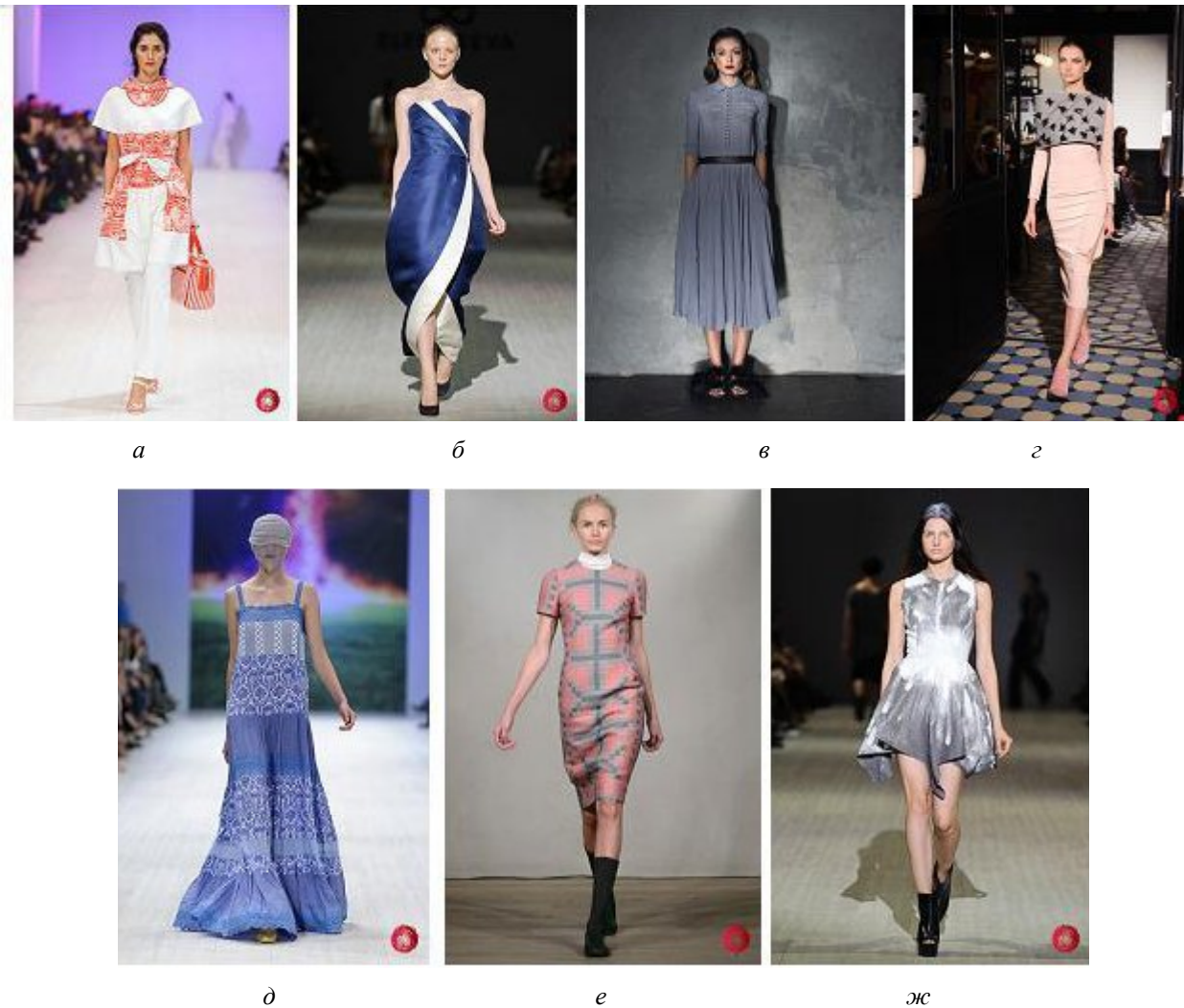
Рис. 2. Зрительные иллюзии в коллекциях украинских дизайнеров 35 UFW [6]

4. Выявление взаимосвязи отделки и зрительных иллюзий, возникающих в результате применения разных отделок в одежде, позволило разработать новые подходы к классификации видов отделки как графического средства зрительного восприятия на общем объеме изделия по критериям «линия–пятно–силуэт».