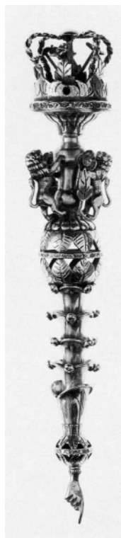
Рис. 4. Указка для Тори. Галичина поч. XX ст. (Єврейський музей у Нью-Йорку)