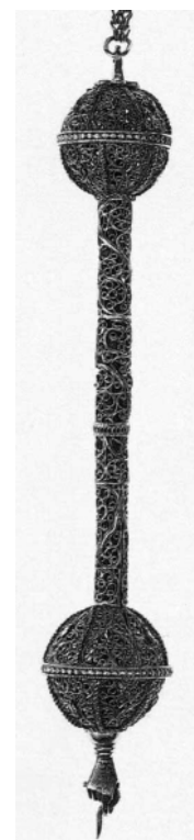
Рис. 8. Указка для Тори. Галичина XIX ст. (Єврейський музей у Нью-Йорку)