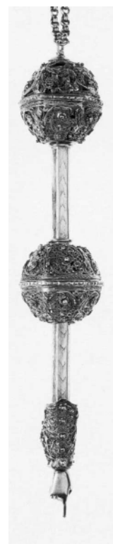
Рис. 7. Указка для Тори. Галичина перша половина XIX ст. (Єврейський музей у Нью-Йорку)