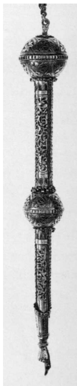
Рис. 2. Указка для Тори. Галичина 1800-1 рр. (Єврейський музей у Нью-Йорку)