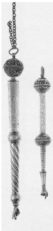
Рис. 1. Указка для Тори. Галичина 1753-54 рр. (Єврейський музей у Нью-Йорку)