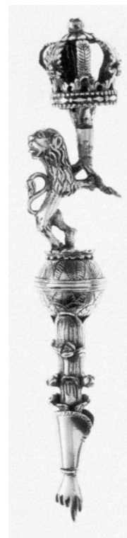
Рис. 5. Указка для Тори. Галичина поч. XIX ст. (Єврейський музей у Нью-Йорку)

позиційного вирішення є дві, пропорційно великі філігранні кулі та манжет руки вказівної частини. В основі декоративного оздоблення — надзвичайно пишна рослинна орнаментика, запозичена з барокової стилістики. Поєднання великих об'ємів кулі та манжета з практично гладкою та тонкою поверхнею стержнів створює додатковий фактурний контраст. Незважаючи на невеликі розміри указки (29,5 см), її формам притаманна урочистість і певною мірою монументальність.