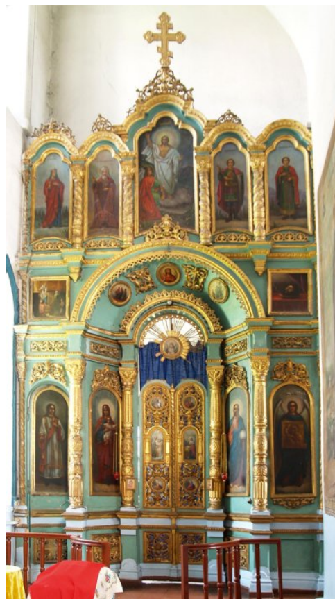
Рис. 2. Иконостас придела Владимирской иконы Богородицы Знаменского храма в с. Боржи. 1886 г.

Правый придел освящен в память св. Тихона Задонского (ил. 3). В перспективном портале Царских Врат помещены местные ростовые иконы Спасителя и Богородицы. Царские Врата иконографически решены подобно Вратам центрального иконостаса. В арке над вратами в центре – образ Ветхого Деньми, справа Спаса Вседержителя, слева – Тихвинская икона Богородицы. Над Вратами в круглом медальоне, окруженном резным сиянием, помещен образ Бога Духа Святого в виде голубя.