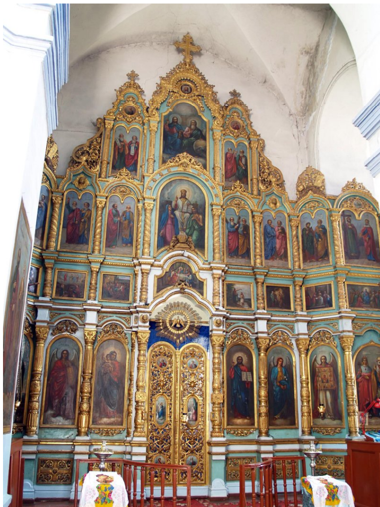
Рис. 1. Иконостас Знаменского храма в с. Боржи. 1886 г.