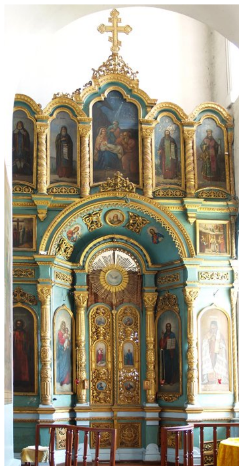
Рис. 3. Иконостас Тихоновского придела Знаменского храма в с. Боржи. 1886 г.

Третий ряд решен как дополнение к деисисному чину центрального иконостаса. В центре – икона «Рождество Христово», слева – образы св. Митрофана Воронежского и прп. Феодосия Печерского, справа иконы прп. Антония Печерского и св. Феодосия Черниговского. Над иконой «Рождество Христово» водружен крест.