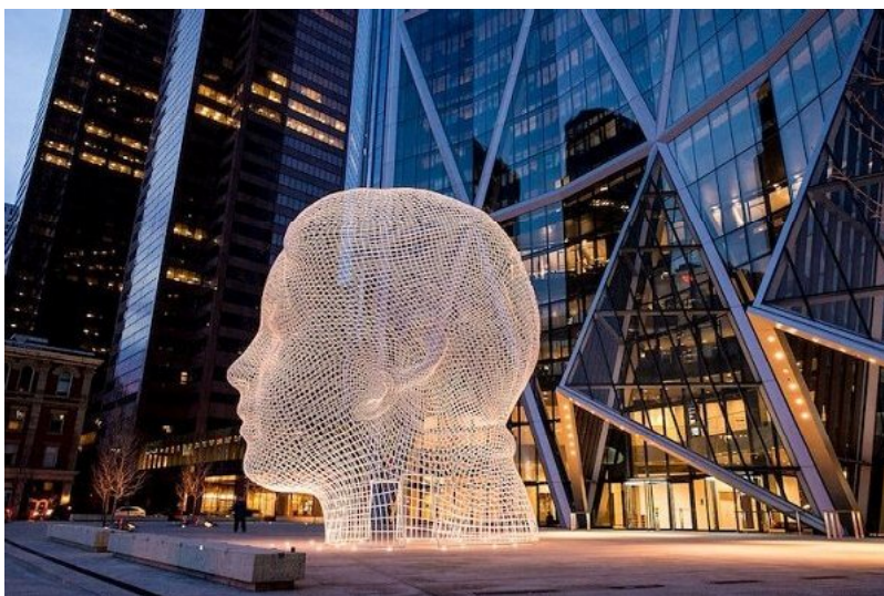
Рис. 4. Скульптура «Wonderland» Жауме Пленсы [17]