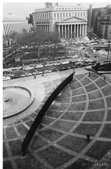
Рис. 2. Скульптура «Накрененная арка» Серра [17]

8. IT-памятники [Электронный ресурс] / Режим доступа: http://alex-not.blogspot.com/2011/02/it.html .