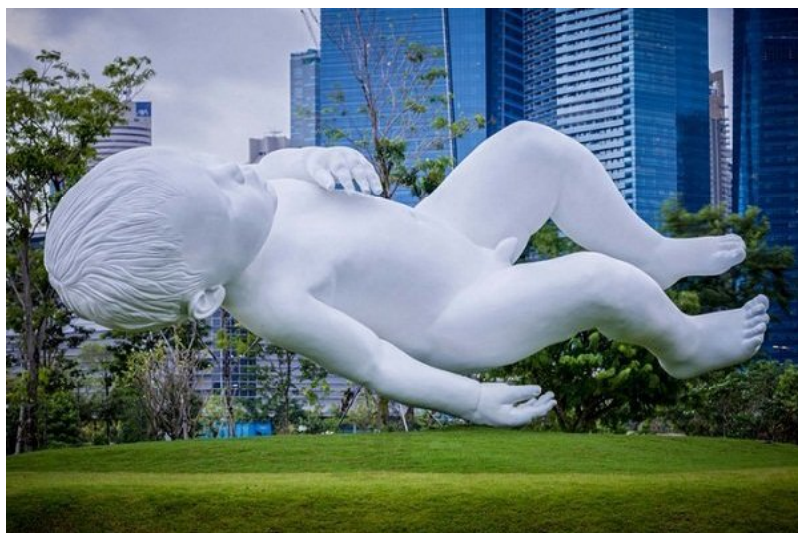
Рис. 3. Скульптура «Planet» в Сингапуре [18]

18. 10 ярких примеров публич-арта в мире [Электронный ресурс] / Режим доступа: http://bit.ua/2013/10/10-yarkyh-prymerov-pablyk-arta-v-myre/ .