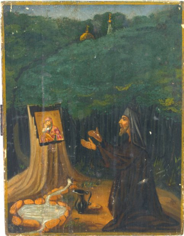
Іл. 4. Явлення Владимирської ікони Пресвятої Богородиці в с. Кочеток. Дерево, масло. Чугуєвська школа. Втор. пол. XIX в. Чугуєв, ЧХММ (ЖВ 53).