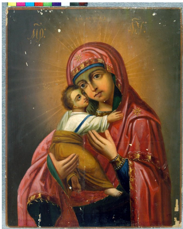
Іл. 2. Владимирская икона Пресвятой Богородицы. Дерево, масло. Чугуевская школа. Втор. пол. XIX в. Чугуев, ЧХММ (Ж 206). Фото Шулики В.В.

В подальших розвідках планується дослідження сюжетного репертуару слобожанського ікономалярства.