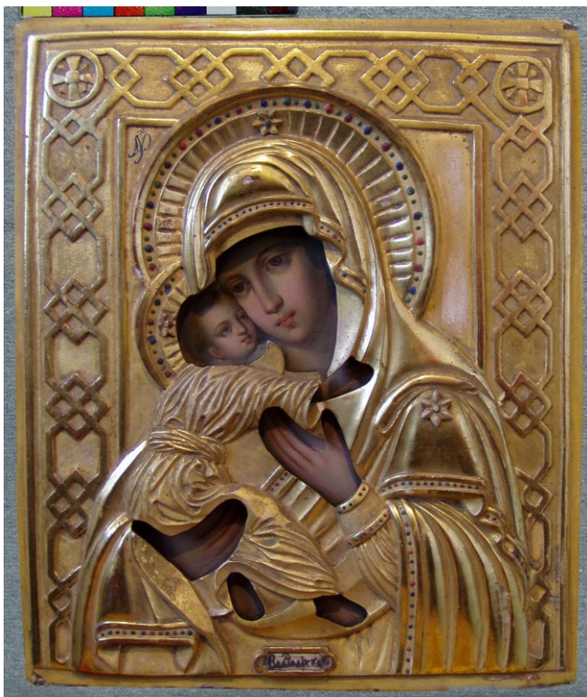
Іл. 1. І. Нечитайлов. Владимирская икона Богородицы. Дерево, масло. Чугуевская школа. 1874. ЧХММ (Ж 47).