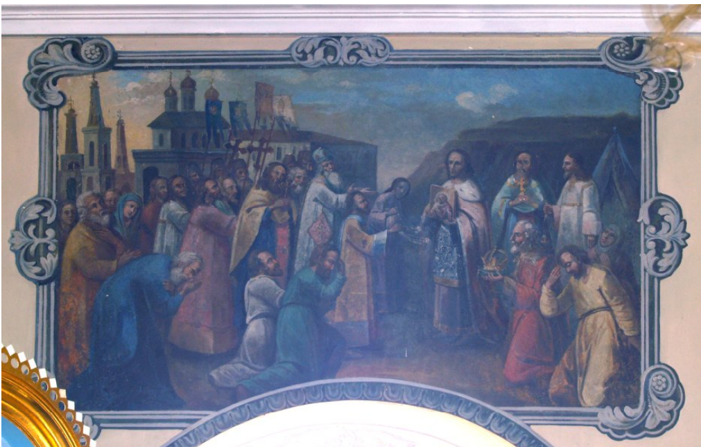
Іл. 6. Сретение Владимирської ікони. Роспись наоса. Сер. XIX в. Кочеток, Чугуєвський район, храм Владимирської ікони Богородиці.