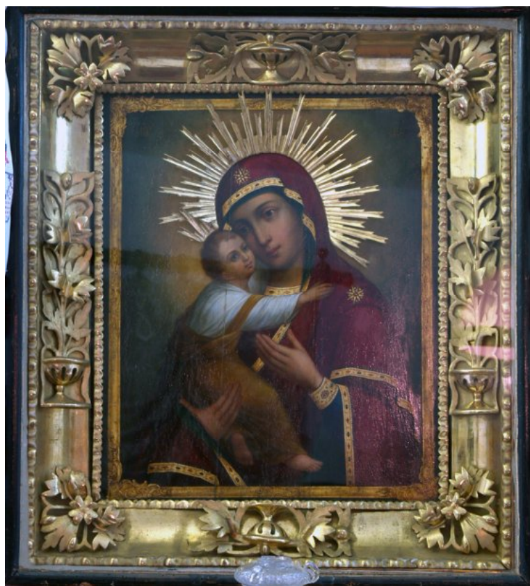
Іл. 3. И. Е. Репин. Владимирская икона Пресвятой Богородицы. Дерево, масло. Чугуевская школа. Втор. пол. XIX в. Чугуев, ЧХММ (Ж 2).