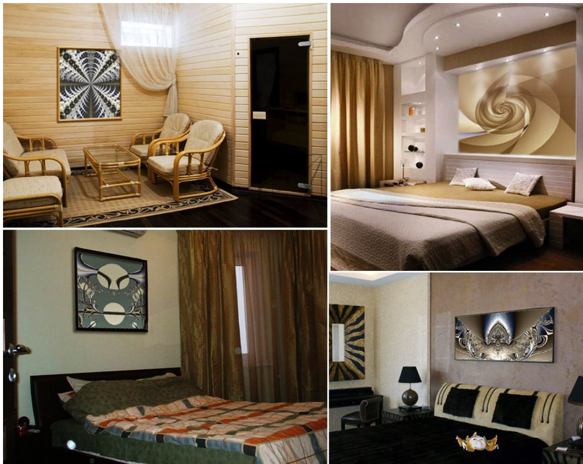
Рис.3. Фрактальні постери в сучасному інтер'єрі.