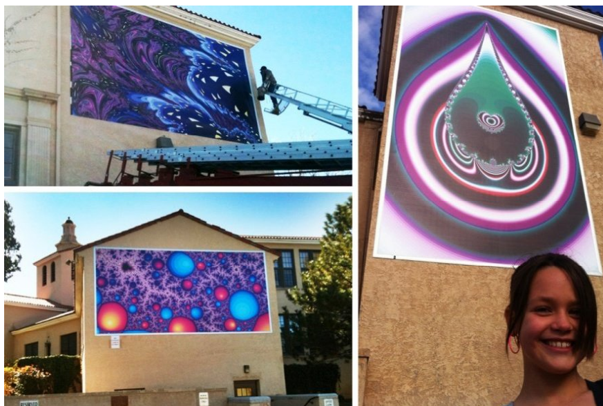
Рис.1. Фрактальні плакати на будівлях містечка Albuquerque, США