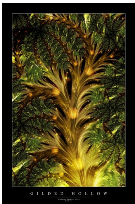
Рис.4. Nicholas Rougeux «Gildedhollow – Позолочені порожнистості», 2004