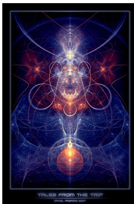
Рис.5. Daniel Radford «Talesfromthetrip - Історії з поїздки», 2007