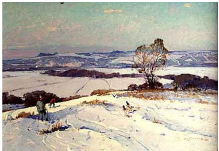
В. Кошовий. Зима у Донбасі. 1986