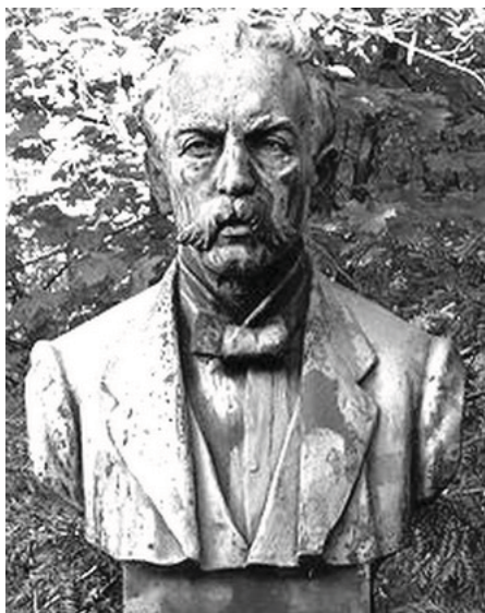
Рис.4 Бюст М. Раціборського [5]