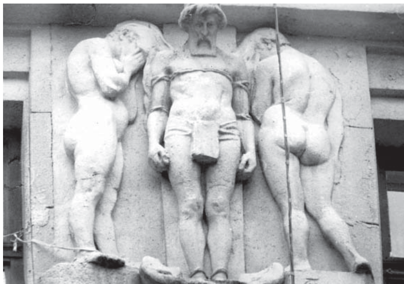
Рис. 6 Скульптурна група Прометей та Океаніди на фасаді кам'яниці по вул. Коциловського, 15 у Львові [16]

Пам'ятник розташований на площі Міцкевича. Це бронзова фігура поета, встановлена на ступінчастому мармуровому постаменті, доповнена низьким стилобатом. Скульптор Тадеуш Блотницький зобразив поета з книгою в руках у хвилину натхнення [12].