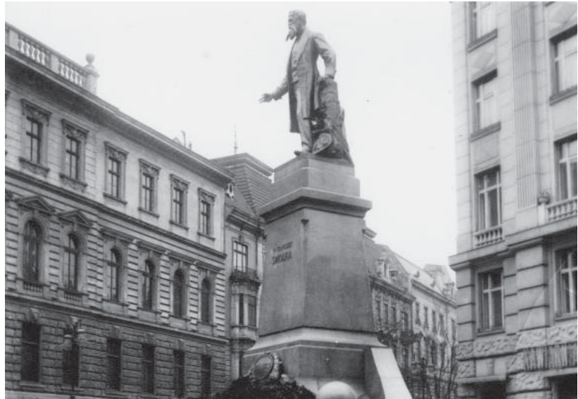
Рис. 2 Пам'ятник Ф. Смольці у Львові. 1913 [10]