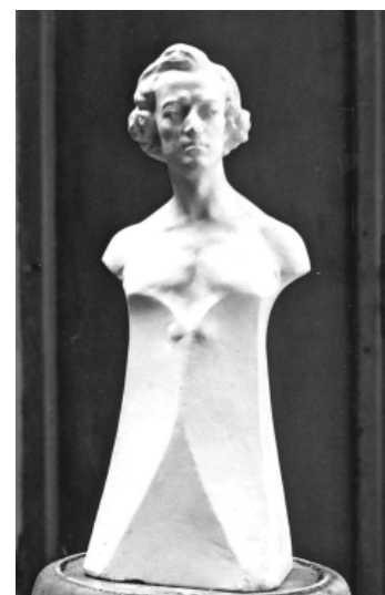
Рис.7 Погруддя Ф. Шопена