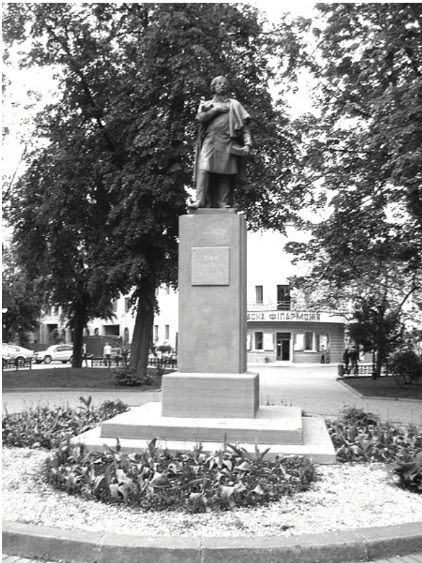
Рис. 3 Пам'ятник А. Міцкевичу в м. Івано-Франківську [12]

на Галицькій площі у Львові (не збережений). У ранній період творчості Т. Блотницький знаходився під впливом академізму і необароко, після 1900 р. скульптор все частіше звертався до символізму. Багато займався монументальною пластикою – проектував і різьбив пам'ятники, архітектурні оздобу [8].