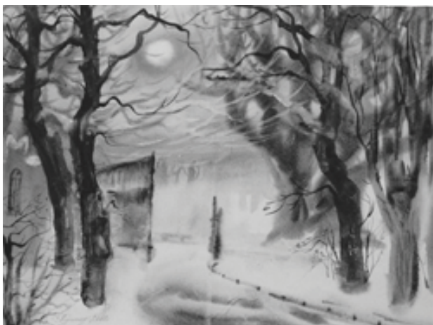
«Зимний пейзаж», б., акв., 38x48, 2000 г.