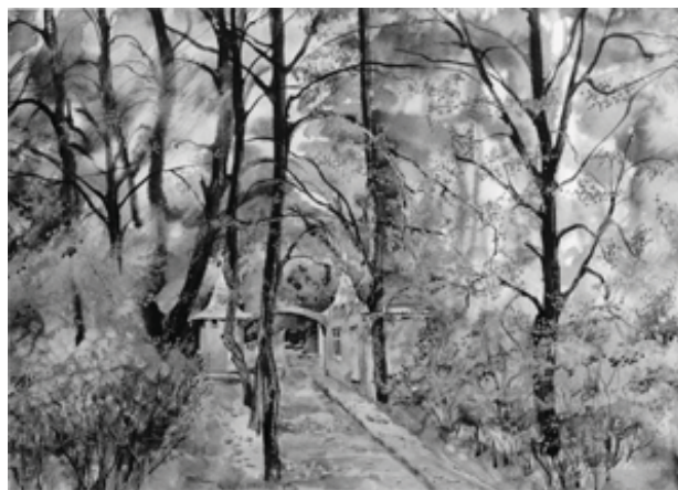
«Осень в парке», б. акв., 38x48, 2000 г.