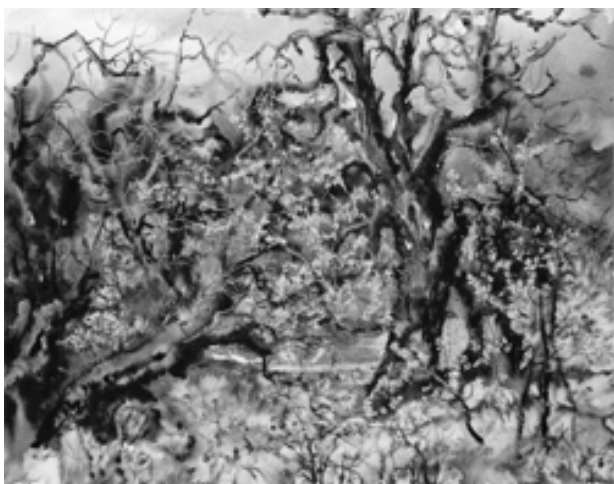
«Весна старых деревьев», б., акв., 48x68, 1999 г.