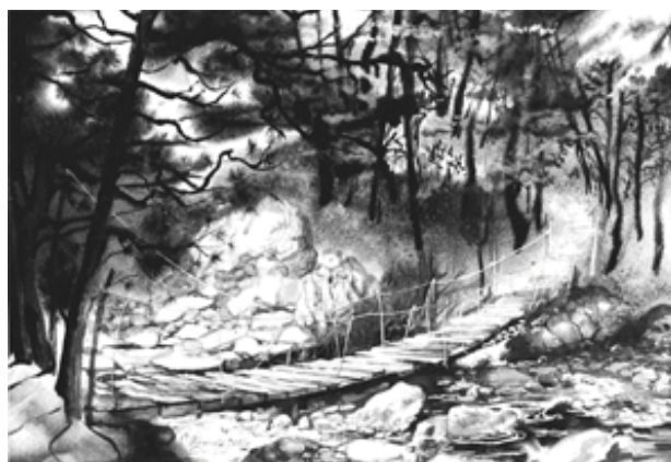
«Большой каньон», б., акв., 80x110, 2001 г.