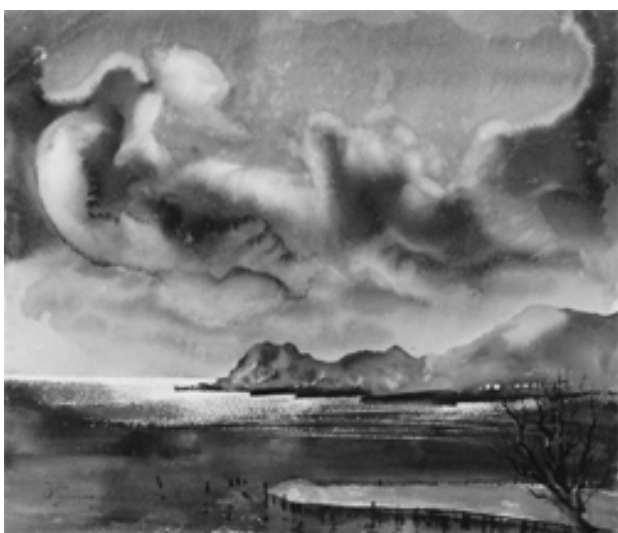
«Ночь. Лунное затмение» (б., акв., 50x60, 1997 г.

который, как считал художник, «несет в себе малую содержательность».