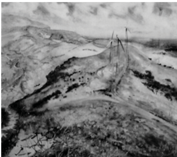
«Весна в Крыму» (2010)

Природа в её акварелях словно «разговаривает» с человеком, повествуя ему цветовыми нюансами о своем состоянии – это и лирическая грусть, «Мостик в Большом Каньоне» (2001), «У причала Гурзуфа» (2002), и эпическая величавость «У Меганомы» (2006), «Кипарисы у моря» (2005), и романтическая взволнованность «Осенний мотив» (2002), «Вечерний звон».